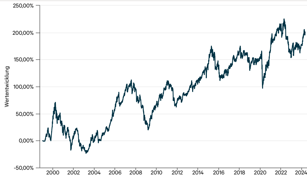
— C-QUADRAT ARTS Best Momentum T