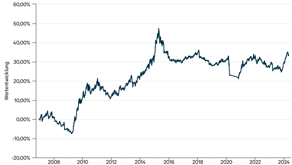
— C-QUADRAT ARTS Total Return Value Invest Protect VT