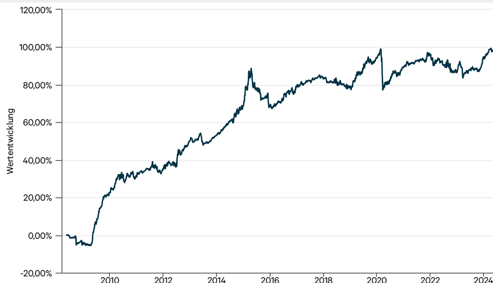
— C-QUADRAT ARTS Total Return Bond VT-I