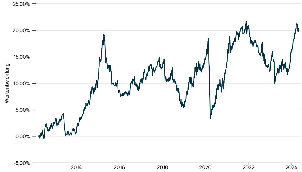
— C-QUADRAT ARTS Total Return Defensive A