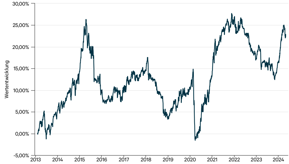
— C-QUADRAT ARTS Total Return Balanced T (CHF hedged)