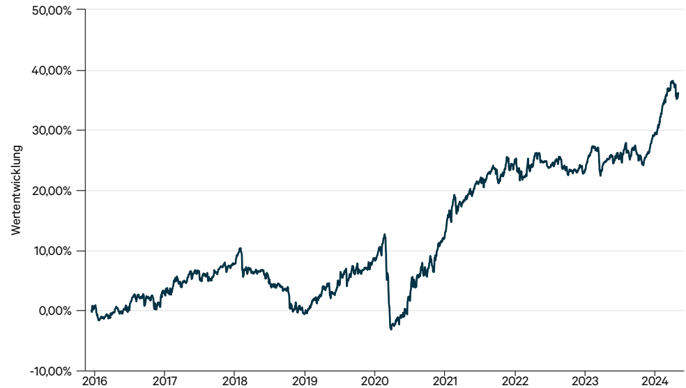
— C-QUADRAT ARTS Total Return Balanced VTA (PLN hedged)