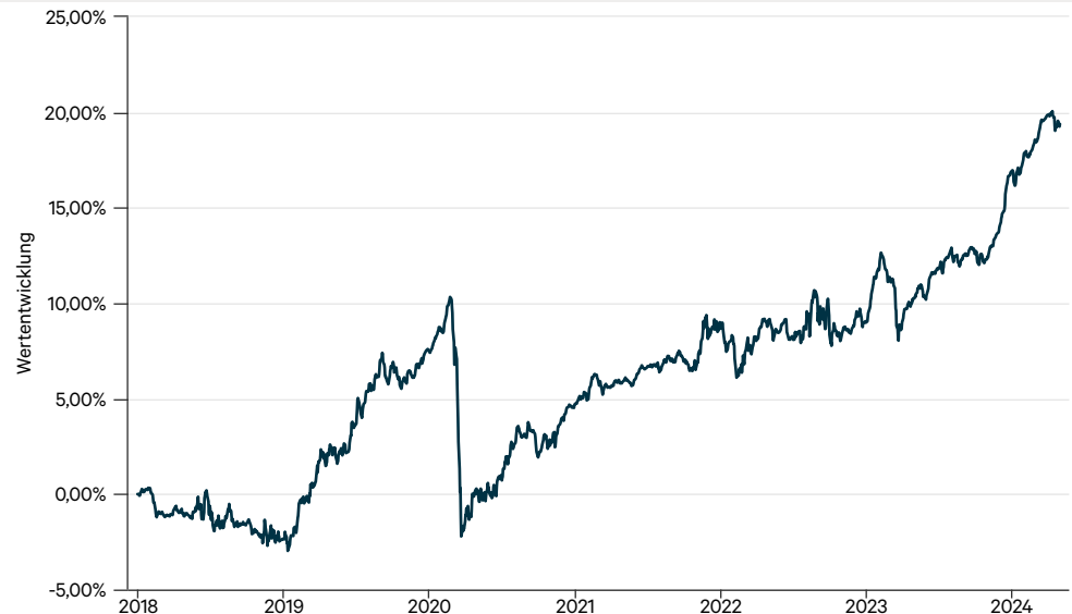
— C-QUADRAT ARTS Total Return Bond VTA (CZK hedged)