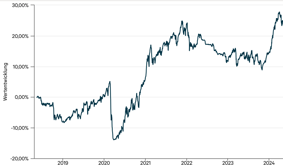
— C-QUADRAT ARTS Total Return Dynamic H