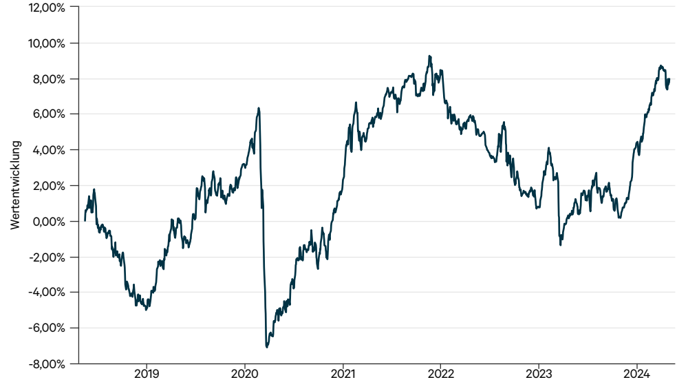
— C-QUADRAT ARTS Total Return Defensive H