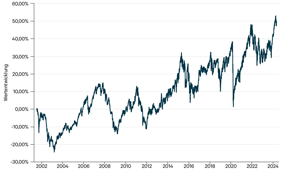
— I-AM ETFs-Portfolio Select EUR (t)