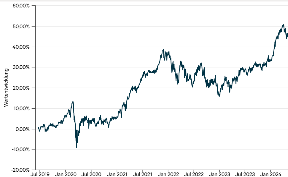
— Equity Risk Control AMI I (a)