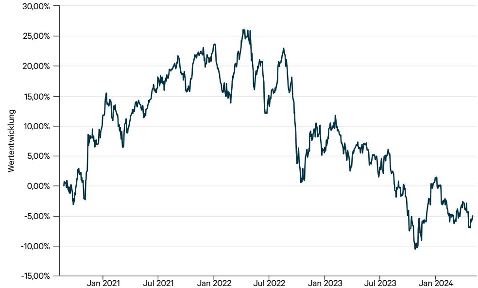
— FAROS Listed Real Assets AMI C (a)