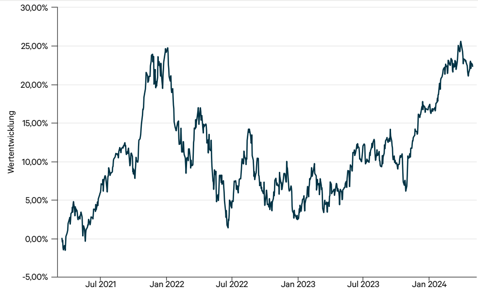
— Globale Aktien Quant Get Capital I (a)