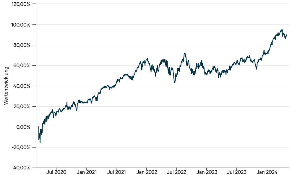
— Ampega AmerikaPlus Aktienfonds I (a)