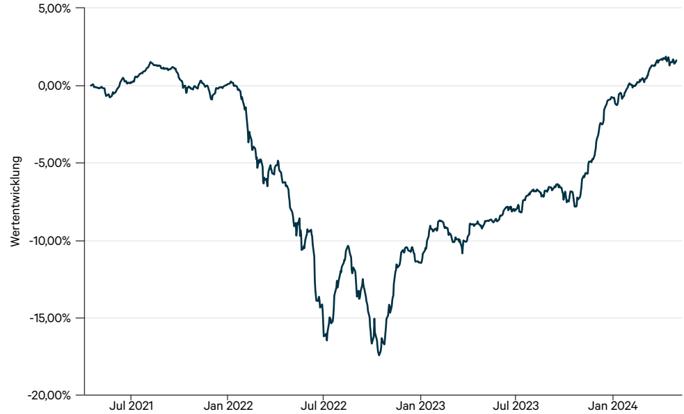
— Ampega Credit Opportunities Rentenfonds I (a)