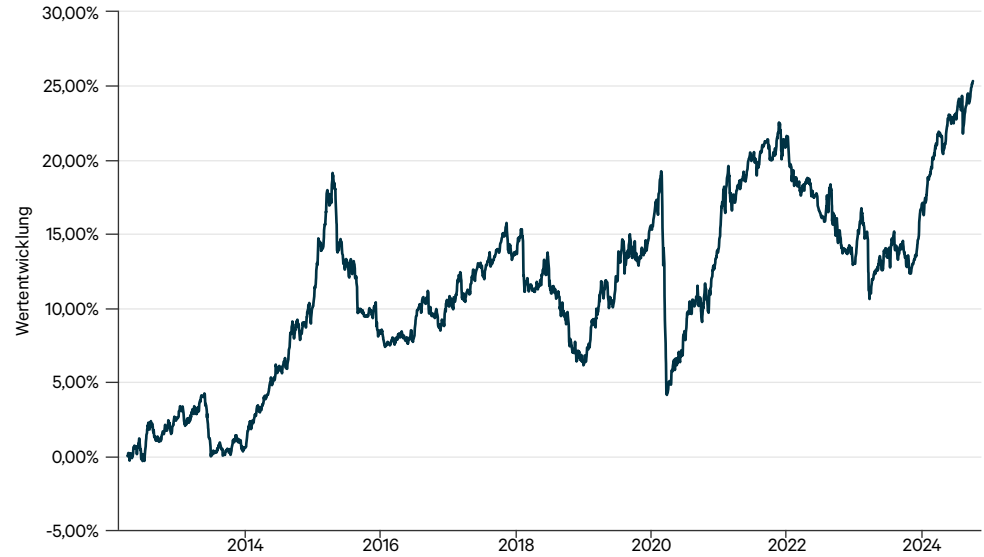
— C-QUADRAT ARTS Total Return Defensive T