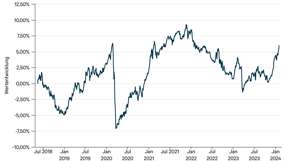
— C-QUADRAT ARTS Total Return Defensive H