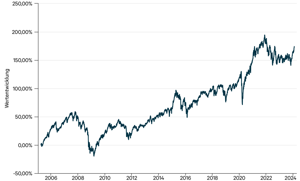
— CT Welt Portfolio AMI CT (a)