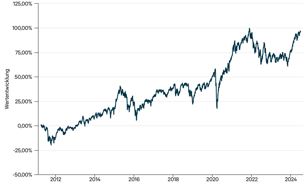
— CT Welt Portfolio AMI PT (a)