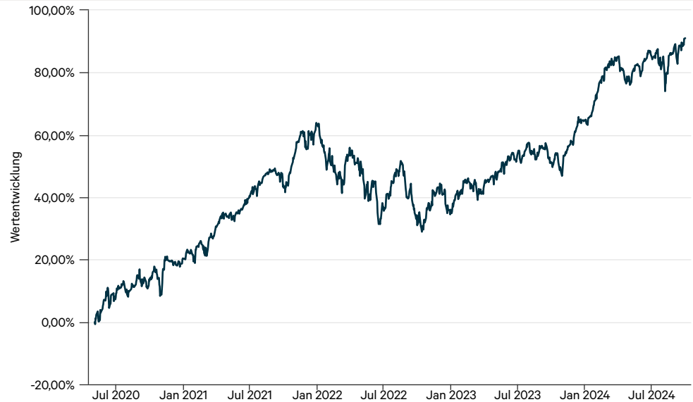
— terrAssisi Aktien I AMI C (t)