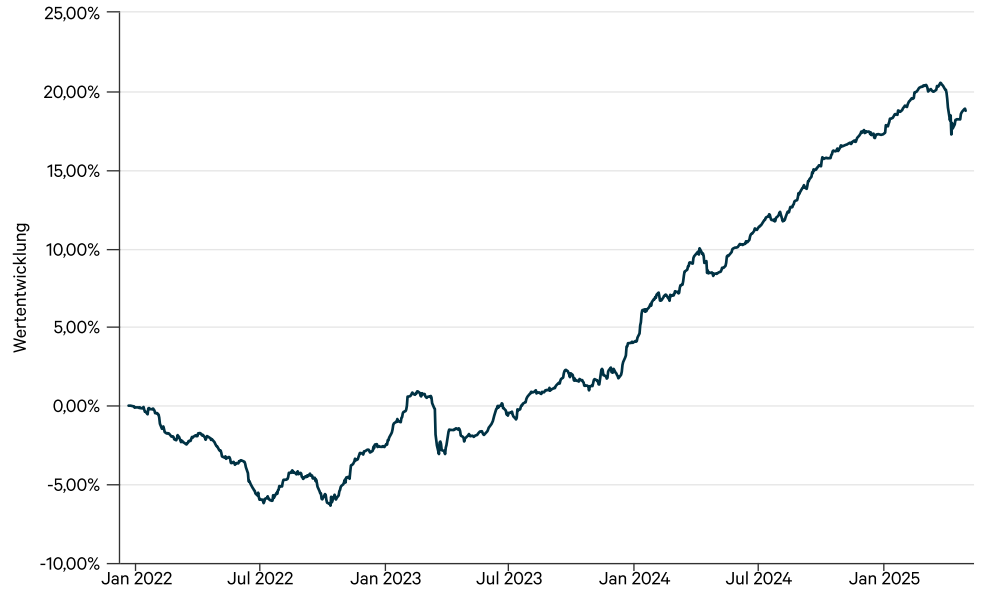
— FS Colibri Event Driven Bonds I (a)