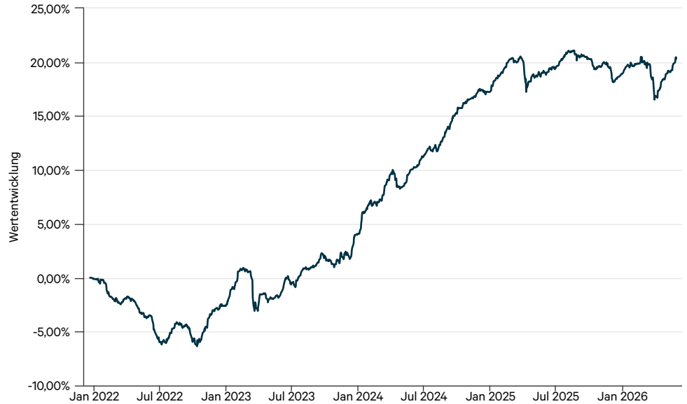
— FS Colibri Event Driven Bonds I (a)