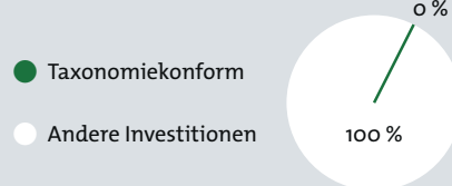
1. Taxonomiekonformität der Investitionen einschließlich Staatsanleihen*