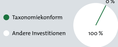
1. Taxonomiekonformität der Investitionen einschließlich Staatsanleihen*